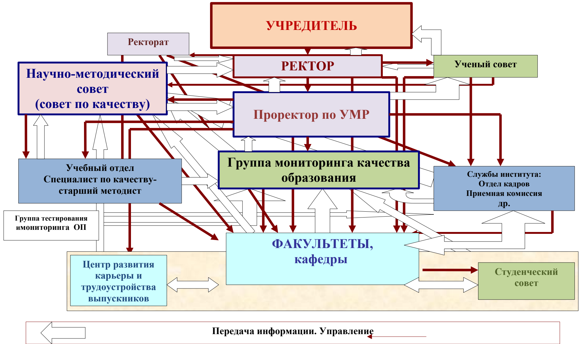
Схема управления качеством образования в ЧУ ВО Институт государственного администрирования