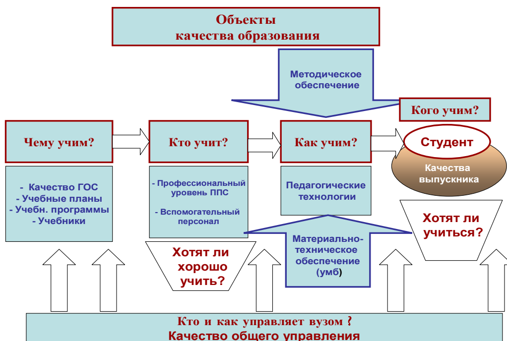
Рис. 1. Объекты качества образования

Важной составляющей высокого качества образования является также психологическая проблема - мотивация участников образовательного процесса . Для обеспечения высокого качества образования мотивация основных участников образовательного процесса — обучаемых и обучающихся — однозначно должна быть положительной и общественно значимой.