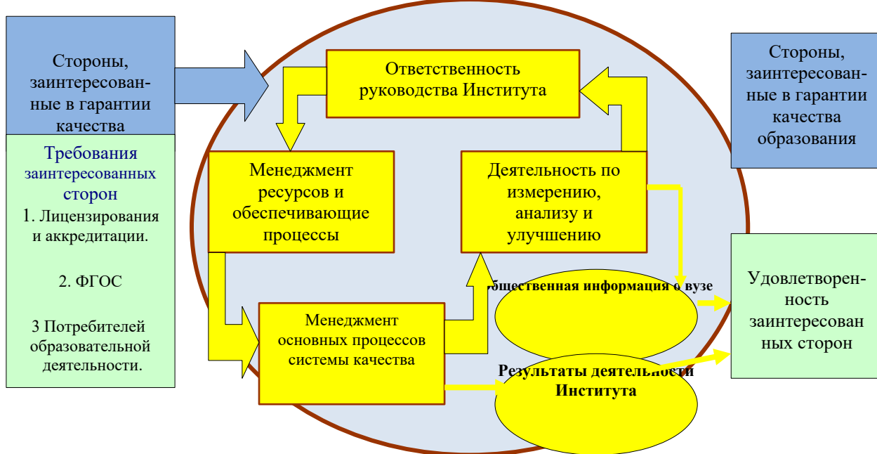
Рис. 3. Модель системы качества Института

Модель системы качества Института (рис. 3) направлена на обеспечение гарантий качества результатов образовательной, научно-исследовательской, воспитательной и иных видов его деятельности. При создании модели качества предполагается, что надлежащие механизмы гарантии качества действуют в Институте и доступны для независимой внешней экспертизы.