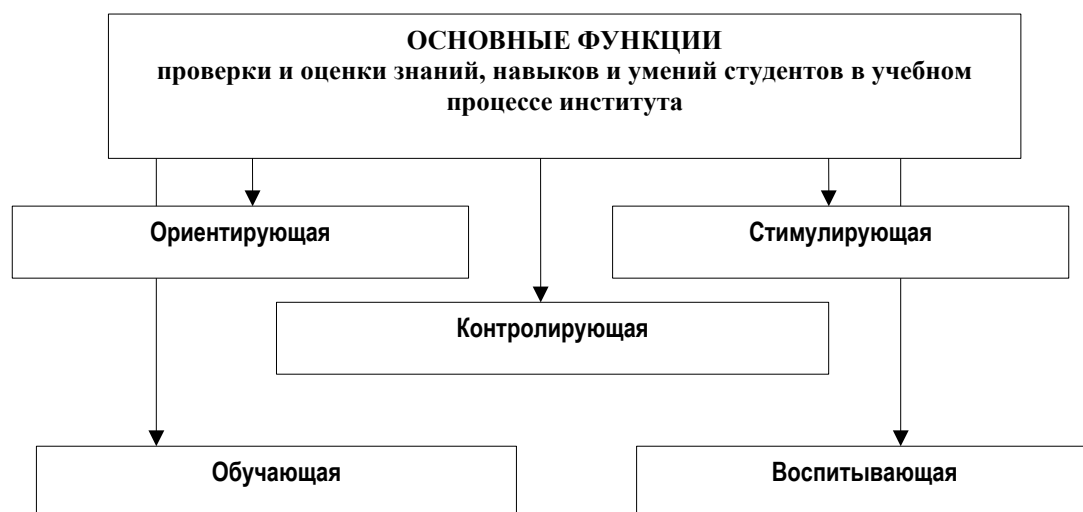
Рис.5. Основные функции проверки и оценки знаний

Ориентирующая функция – полученная оценка дает студенту ориентир насколько успешно он усвоил определенные знания, навыки и умения и способствует их корректировке и совершенствованию; данную функцию обычно выполняют текущая проверка и оценка.